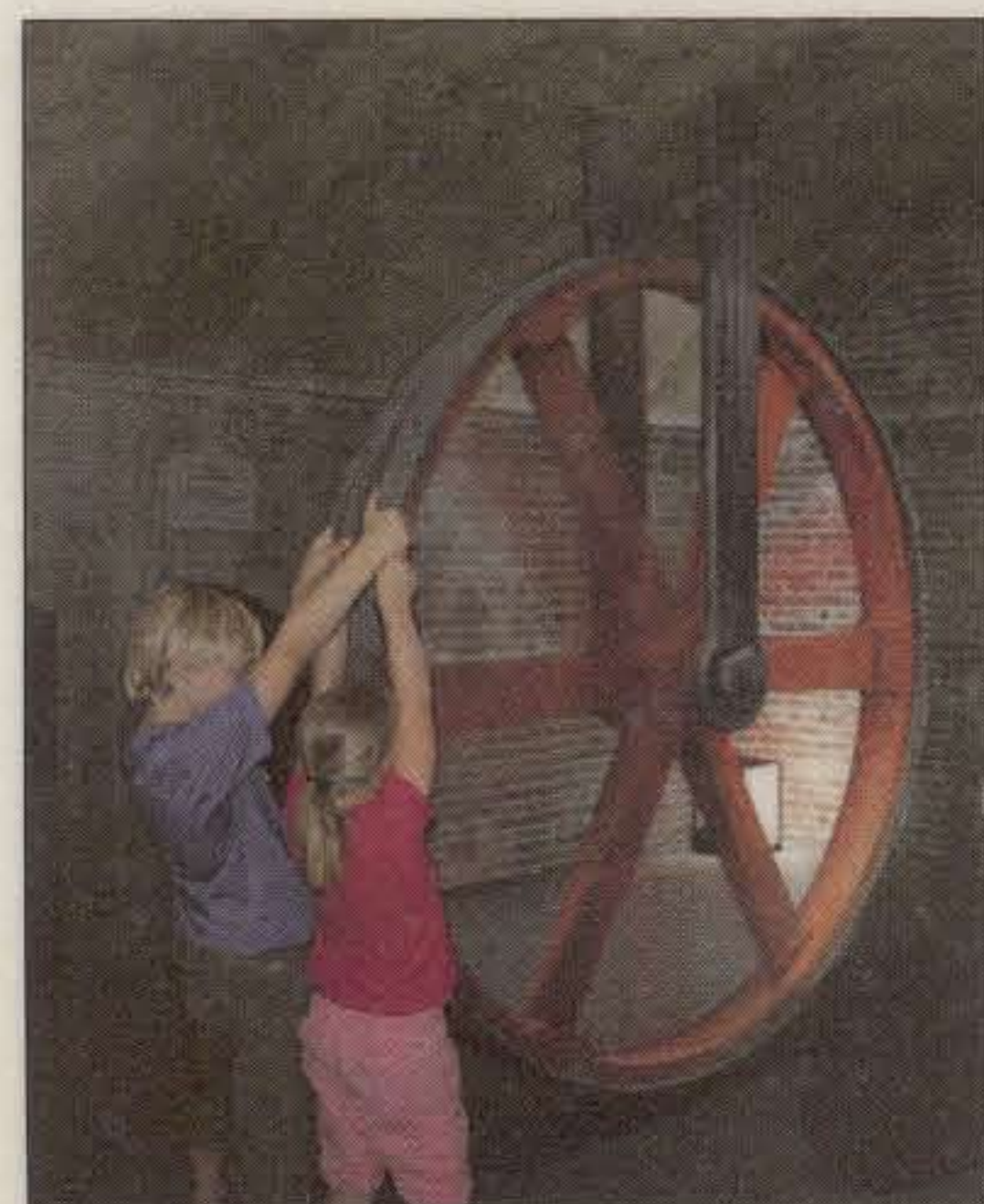
Kinderen draaien aan een wiel van een stoommachine om een animatie over de stroomvoorziening te starten.

“Er wordt veel interactief in het bezoekerscentrum. Zo gaan we bijvoorbeeld werken met glazen panelen in de diverse ruimtes van het eiland.